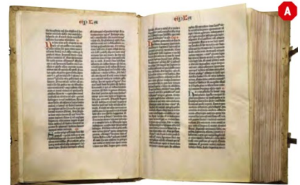
BIBLE DE GUTENBERG. Allemagne, XV e siècle.

L'imprimerie rencontre presque immédiatement un immense succès les imprimeries se répandent dans toute l'Europe et au-delà. En un jour on imprime plus qu'on écrit en une année.