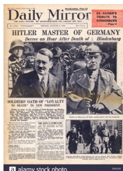
Hitler à la présidence, 1934