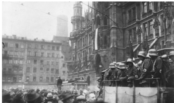
Putsch de Munich, 1923

Observe ces images et remet-les dans l'ordre chronologique des événements.