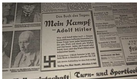
Encart publicitaire pour Mein Kampf dans le journal nazi, 30.01.1933