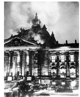
Incendie du Reichstag, 1933