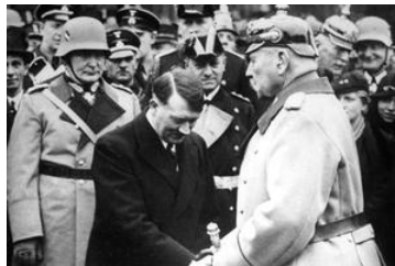
Hitler, chancelier, devant Hindenburg, 1933