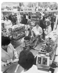
Supermarché, Zurich, 1974

A présent, pour continuer d'étudier la période qui succède la 2 ème Guerre Mondiale, prends ton livre d'histoire à partir de la page 135.