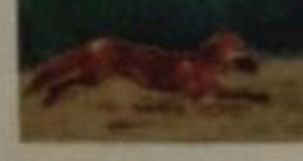
Les rongeurs prédateurs des rongeurs dans leur territoire.