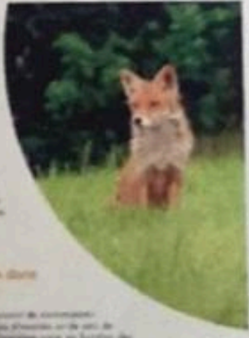
Un mammifère prédateur des rongeurs dans son territoire.