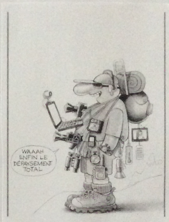
Sur un voyage à 5'200.00 en Afrique du Sud

b) Que peux-tu en déduire sur les retombées économiques pour le pays ?